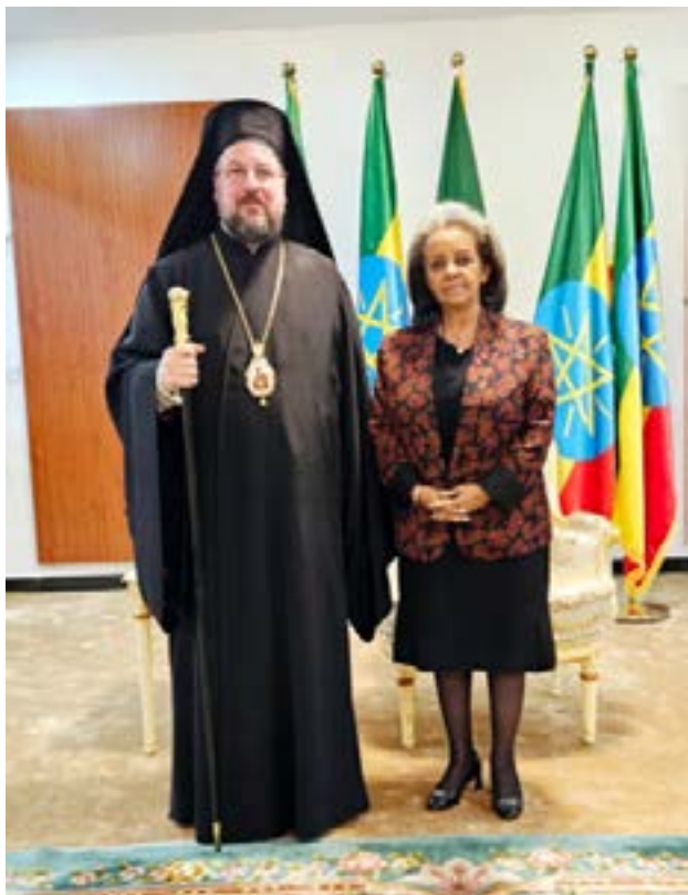
Ελλάδας και Αιθιοπίας.

Σε ζεστή και εγκάρδια ατμόσφαιρα πραγματοποιήθηκε στο Προεδρικό Γραφείο γόνιμη συνάντηση μεταξύ η Εξοχωτάτης Προέδρου της Δημοκρατίας της Αιθιοπίας κας Sahle-Work Zewde και του Σεβασμιωτάτου Ελληνορθόδοξου Μητροπολίτου Αξώμης κ. Δανιήλ.